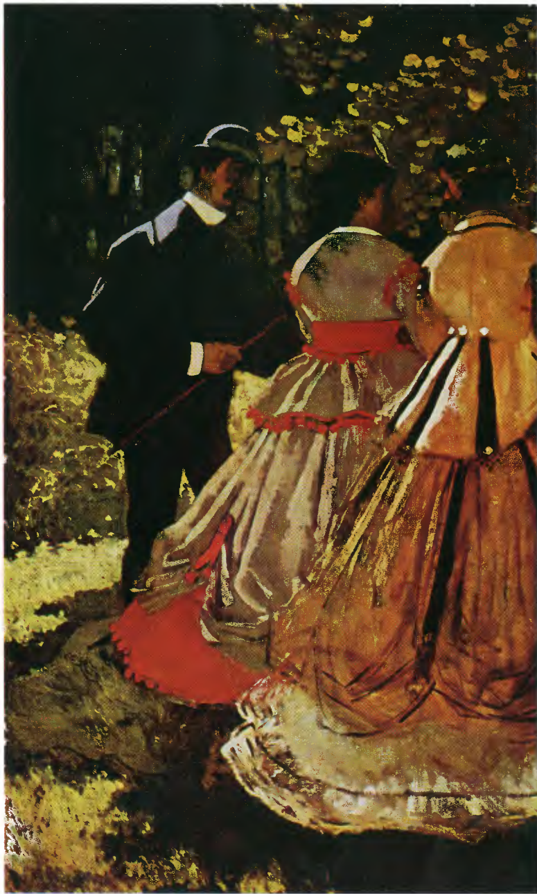
Claude Monet: Frammento del "Déjeuner sur l'herbe"