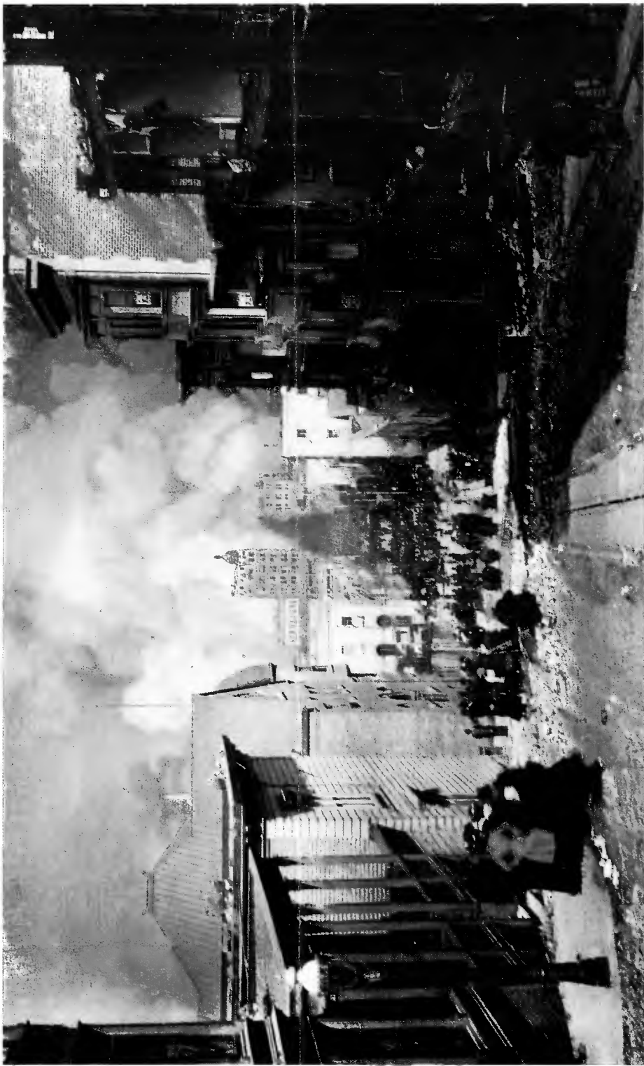
4 - Arnold Genthe: La città in fiamme. San Francisco (1906) , fotografia