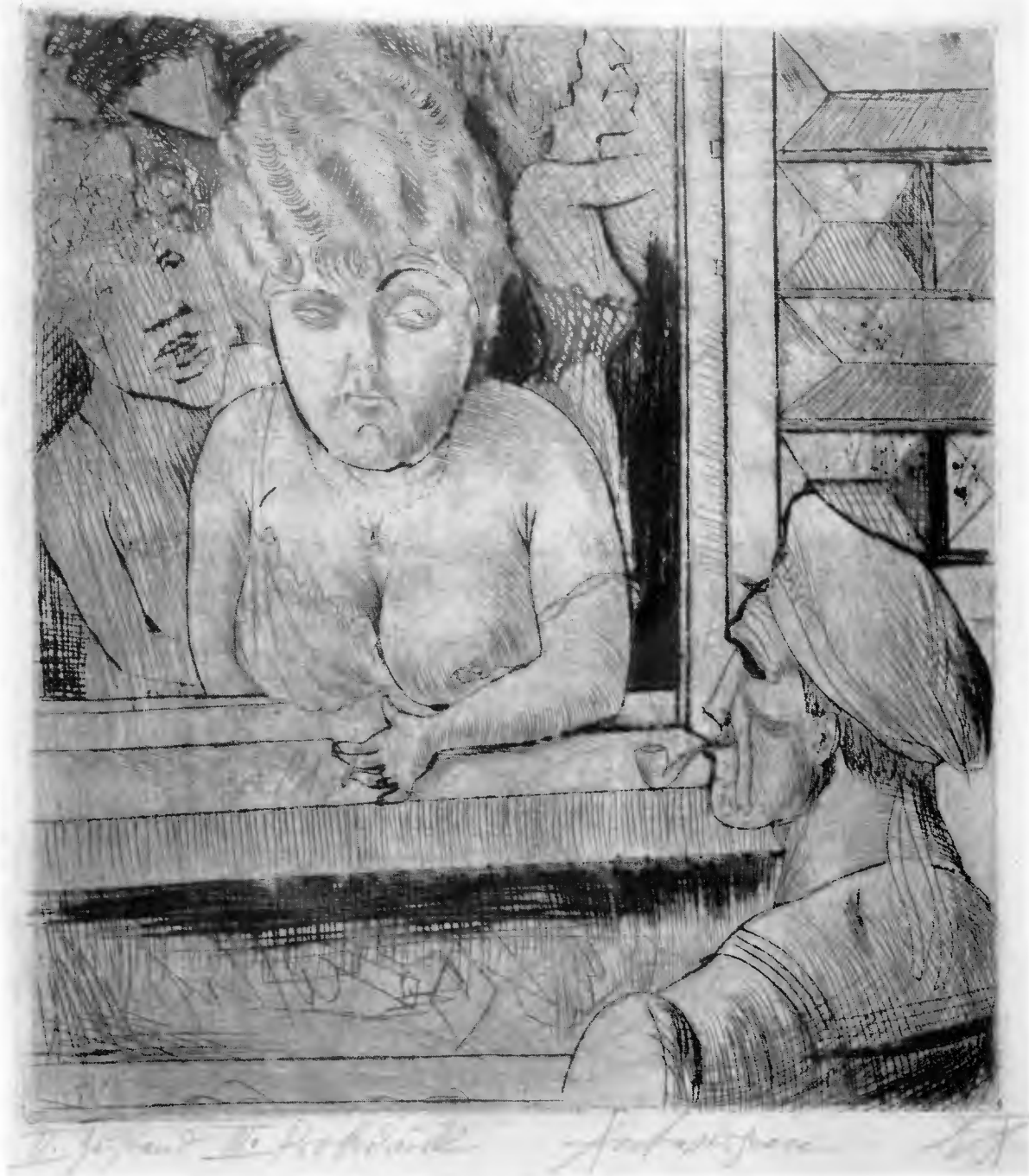
6 - Otto Dix: Anversa (1922)