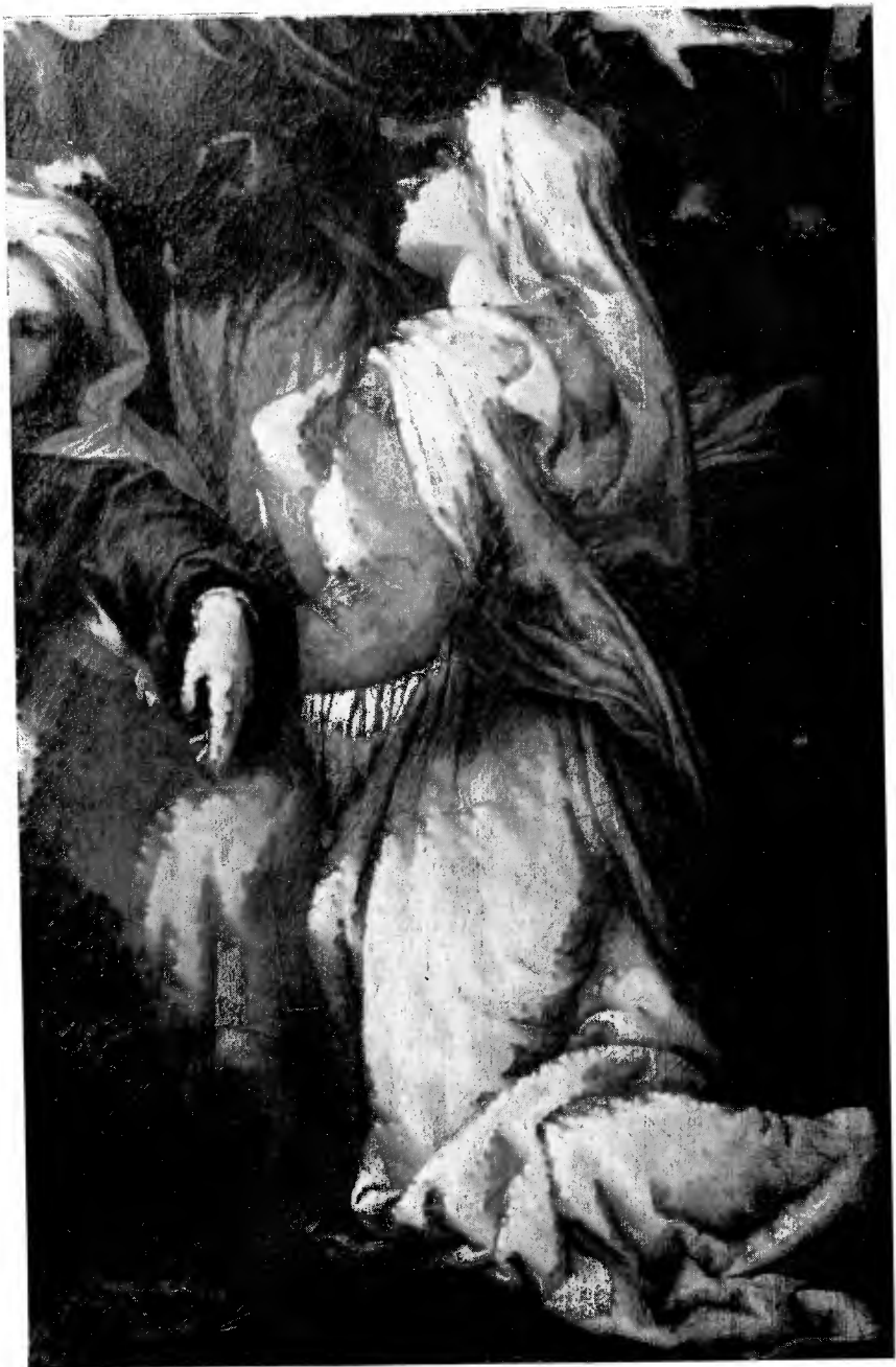
LORENZO LOTTO: Una delle Marie nella Crocefissione (Monte San Giusto - S. Maria in Telusiano)